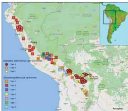
Рис. 1. Южноамериканский очаг происхождения Globodera pallida и Globodera rostochiensis (по А. С. Суботину, 2021)

На рисунке 1 приведена составленная С. А. Суботиным картограмма Южноамериканского очага происхождения БКН и ЗКН. Этот регион является одной из тридцати шести горячих зон биоразнообразия (Тропические Анды) [2].